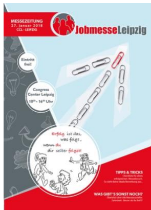
Jobmesse Leipzig online