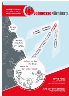
Jobmesse Nürnberg online