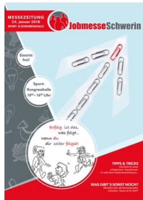
Jobmesse Schwerin online